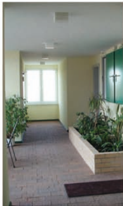
Laubgänge und Vorgärten