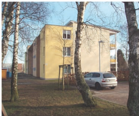
Ansicht von Nord-West