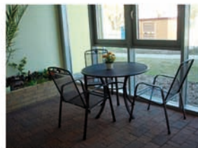
Blick in eine Sitzzone