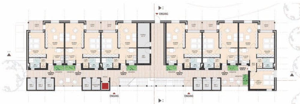
Grundriss Erdgeschoss (ohne Maßstab)