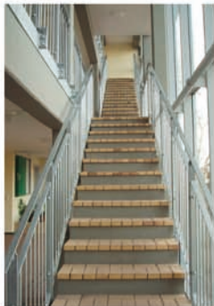
Blick ins Treppenhaus