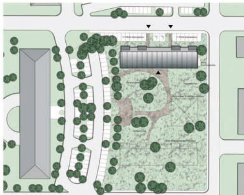
Lageplan (ohne Maßstab)