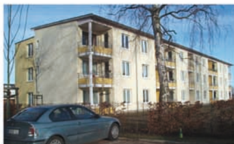
Ansicht von Süd-West