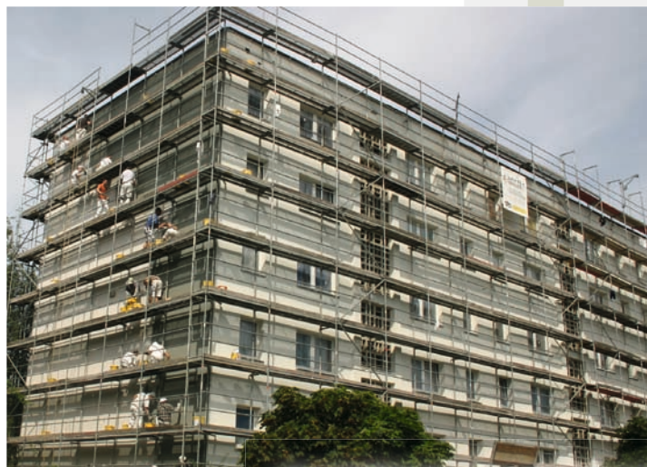
Energieeffiziente Sanierung im Bestand Vierower Wende 1 - 4

Für den sinnvollen Einsatz mit Energieressourcen ist die WVG 2007 mit dem Deutschen Bauherrenpreis ausgezeichnet worden. Die WVG wird sich mit ihren Möglichkeiten auch in Zukunft mit dem Thema Nachhaltigkeit und Klimaschutz auseinandersetzen, weil Klimaschutz eben kein Selbstläufer ist.