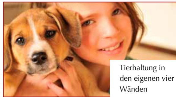
Tierhaltung in den eigenen vier Wänden